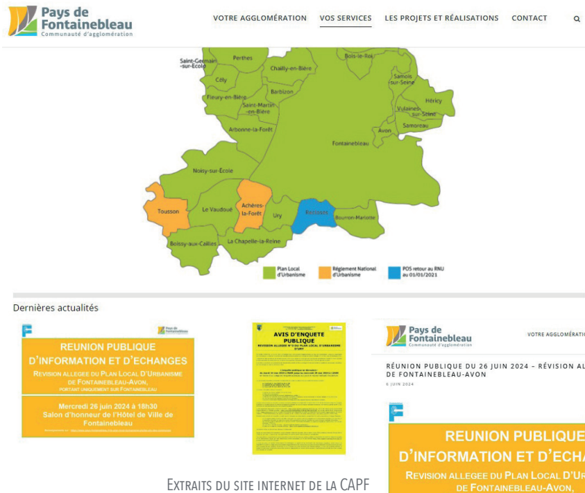
EXTRAITS DU SITE INTERNET DE LA CAPF